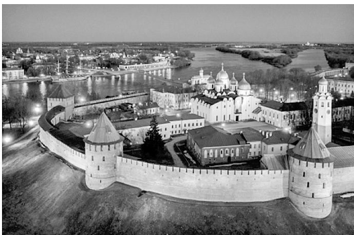
Η πόλη του Νόβγκοροντ.

τολικά συνεχίζει προς την Αγία Πετρούπολη και το Ελσίνκι της Φινλανδίας· νοτιοδυτικά συνεχίζει προς το Καλίνινγκραντ, το γερμανικό Κένιγκσμπεργκ, πόλη του Immanuel Kant (Ιμμάνουελ Καντ) και πρωτεύουσα της Ανατολικής Πρωσίας, το Γκντανσκ, πρώην Ντάντσιχ, και τα ιστορικά λιμάνια της βόρειας Γερμανίας, όπως το Λύμπεκ, πρώτη έδρα της Χανσεατικής Λίγκας, και το Κιέλο. Ενδιαμέσως έχουμε την εγκατάσταση της Χάνσας στην πόλη Βίσμπε, λιμάνι του σουηδικού νησιού Γκότλαντ στη Βαλτική, ενώ δυτικότερα, η Χάνσα είχε αντιπροσώπους στο Αμβούργο, στην Μπρυζ ακόμα και στο Λονδίνο.