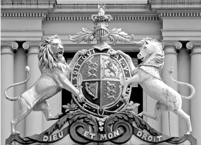
Θυρεός του αγγλικού στέμματος.

δος Α', πιο γνωστός ως Ριχάρδος ο Λεοντόκαρδος, που βασίλευσε μεταξύ 1189-1199, και αργότερα ο Βασιλιάς Ερρίκος ο Ε', με το επιχείρημα ότι είχαν και γαλλική καταγωγή αλλά επιπλέον αποσκοπώντας να στηρίξουν τις βλέψεις τους επί του γαλλικού στέμματος. Μέχρι και τον 15ο αιώνα, οι Άγγλοι και οι Γάλλοι βασιλείς εποφθαλμιούσαν ο ένας τον θρόνο του άλλου, ενώ μεσολάβησαν και περίοδοι «διττής μοναρχίας», με την «ένωση» των δύο κρατών κατά τη διάρκεια του Εκατονταετούς Πολέμου μεταξύ Γαλλίας και Αγγλίας, περίοδο κατά την οποία έδρασε η Jeanne d'Arc (Ιωάννα της Λωραίνης) στηρίζοντας τον «νόμιμο» Γάλλο βασιλιά μέχρι τη λήξη του πολέμου, το 1453. Αυτά ως απόηχος των εγκαλλισμένων Σκανδινα-