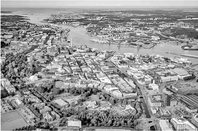
Ο πορθμός του Κάτεγατ.

επιβάλλει διόδια που αποτελούσαν το κυριότερο έσοδο του κράτους μέχρι το 1857, όταν ο διάυλος αυτός αναγνωρίστηκε ως διεθνής. Λίγο πιο νότια, υπάρχει από το 2000 η Γέφυρα του Όρεσουντ, που συνδέει οδικώς και σιδηροδρομικώς την πρωτεύουσα της Δανίας Κοπεγχάγη με την πόλη Μάλμε της Σουηδίας, κοντά στην οποία βρίσκεται και η γνωστή πανεπιστημιούπολη της Λουντ.